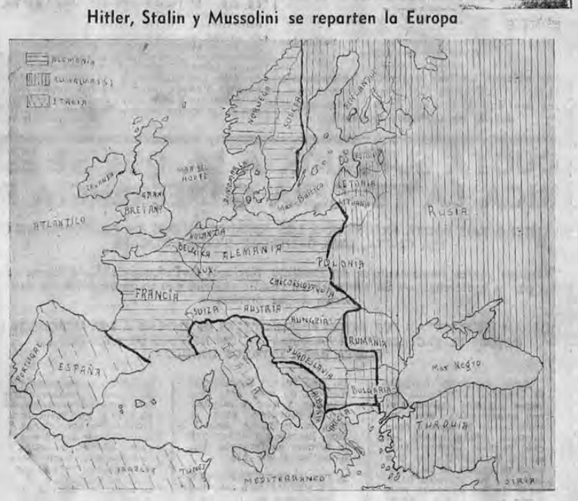
Muestra este mapa de Europa las zonas dominadas militar, política o económicamente por los tres poderes totalitarios europeos; Hitler comparte con Stalin el predominio político y económico en Suecia, Rumania y Bulgaria; lo tiene de hecho en Hungría y militarmente es dominador de Francia, Bélgica, Luxemburgo, Dinamarca, Noruega, Checoslovaquia, Austria y media Polonia; Stalin además de compartir con Alemania el dominio indicado antes, militarmente es dueño de Lituania, Estonia, Letonia y la Besarabia y Bukovina rumanas; su poder político influye decisivamente en Finlandia y en Turquía. El poder político de Mussolini se afirma cada día más en España y en Grecia, domina militarmente la Albania, tiene una vasta zona de influencia en la Yugoslavia del Adriático y se afianzará en Argelia, Túnez y Córcega. Es así como quedarán absolutamente dominadas, por estos tres jefes las naciones total del continente. Suiza y Portugal tendrán que caer en las esferas de acción de Hitler o Mussolini si es que al final Alemania vence a Inglaterra.

LOS DOMINIOS Letonia, Estonia y Lituania en las márgenes del Báltico, desde Leningrado hasta la Prusia oriental,